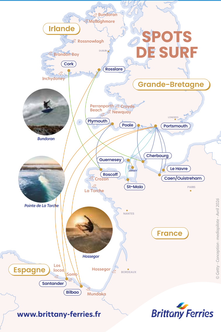
Conception : medapilote - Avril 2026